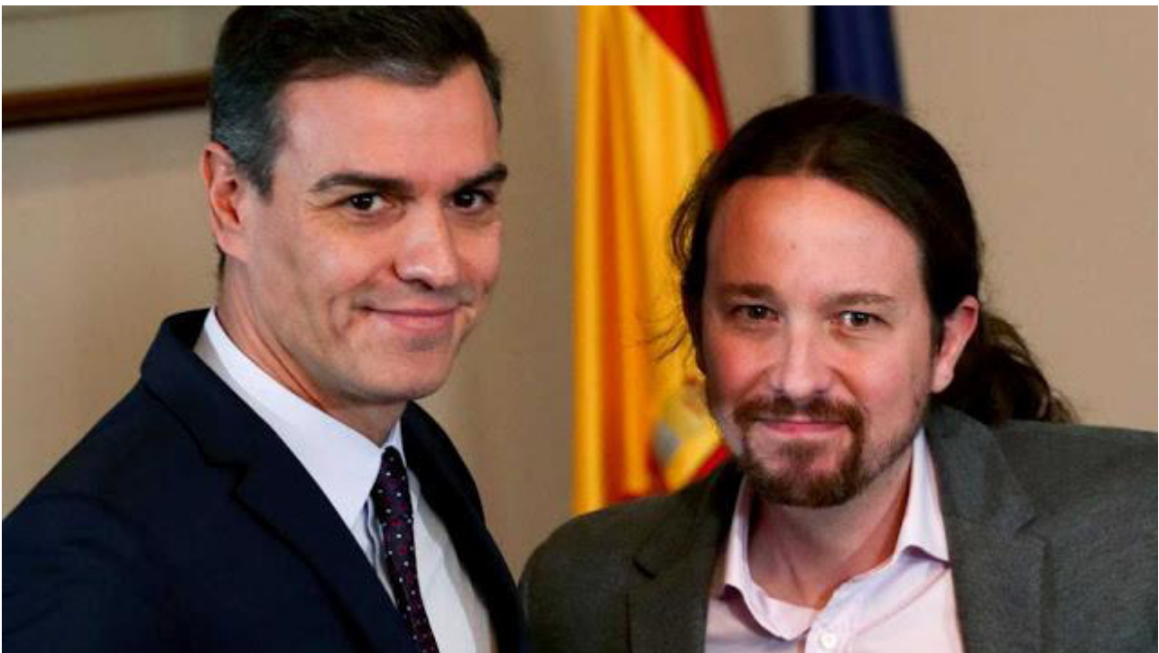
Sánchez e Iglesias en una imagen de archivo

Los líderes mejor vaolorados son Sánchez, Arrimadas, Iglesias y Garzón, pero desciende el porcentaje de aprobación para todos menos para Pablo Casado, que se mantiene.