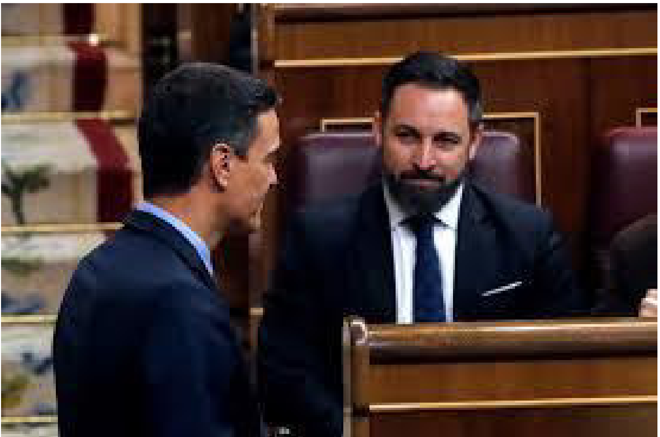
Imagen de archivo. Pedro Sánchez y Santiago Abascal

I OP de Simple Lógica: Intención de voto y valoración de líderes Se incrementa el porcentaje de voto estimado para PSOE (28,5%) y Vox (16,1%) respecto a enero y se mantiene el de Ciudadanos (7,9%).