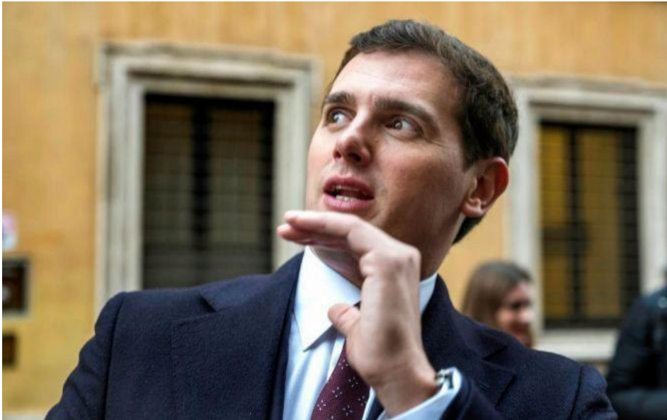
El presidente de Ciudadanos Albert Rivera.